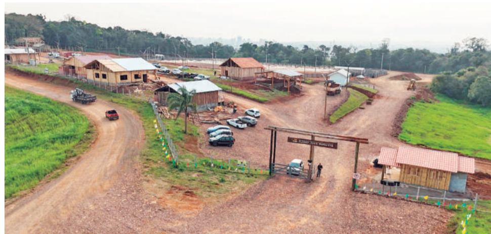
Centro Municipal de Eventos e Tradições Gaúchas Zulmir José Sotoriva